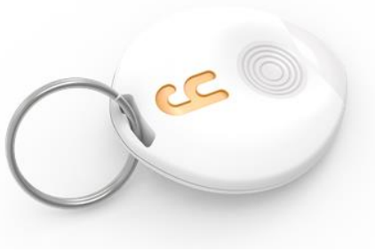
Accessoire Yuzz.it Wearable

Simple, petit, pratique, et compatible avec les systèmes d'exploitation iOS et Android, Yuzz.it Wearable se compose :